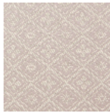
1698-04 CORSET - POUDRE