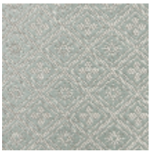
1698-01 CORSET - OPALE