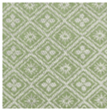
1698-02 CORSET - AMANDE