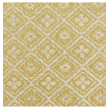
1698-03 CORSET - OR