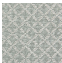
1699-01 GUIPURE - OPALE