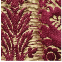
1701-01 CAMMINO - RUBIS