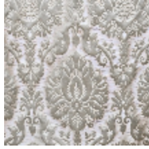
1701-03 CAMMINO - ARGENT