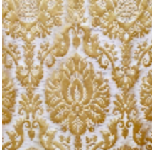
1701-02 CAMMINO - OR