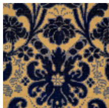
1704-03 HONORE - NUIT