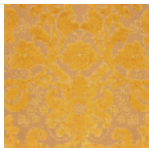
1704-02 HONORE - OR