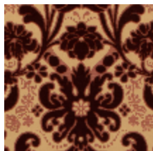
1704-01 HONORE - BORDEAUX