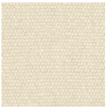
3212-01 SORBIER - ECRU