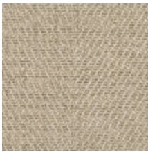
3213-02 FIGUIER - LIN