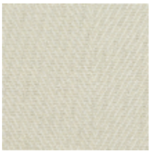
3213-01 FIGUIER - ECRU