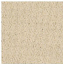
3216-01 FORSYTHIA - GRES