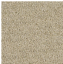
3216-02 FORSYTHIA - FICELLE