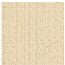
3217-01 HEVEA - GRES