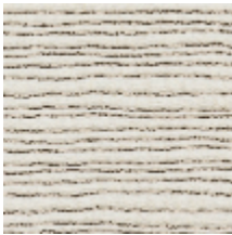
3219-02 GENEVRIER - BRUME