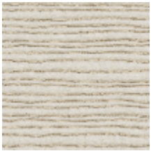
3219-01 GENEVRIER - GRES