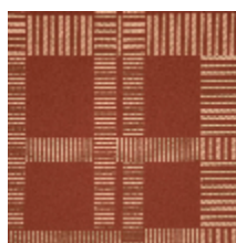
3230-04 SQUARE - BRIQUE