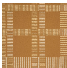
3230-02 SQUARE - CAMEL