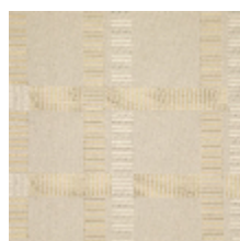
3230-01 SQUARE - NATUREL