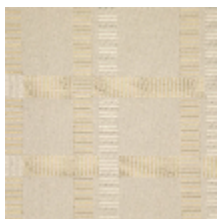
3230-01 SQUARE M1 - NATUREL