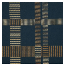
3230-03 SQUARE M1 - MARINE