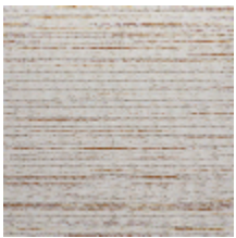
3240-01 BASALTE - NATUREL