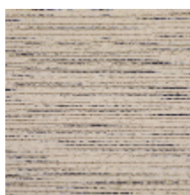
3240-02 BASALTE - GRANIT