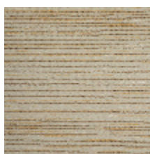
3240-03 BASALTE - ARGILE