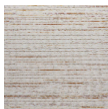
3240-01 BASALTE - NATUREL