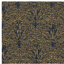
3247-03 DATTIER - NUIT