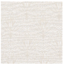
3247-01 DATTIER - NATUREL