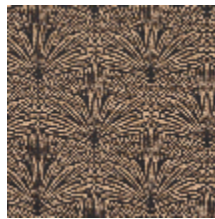
3247-04 DATTIER - ECORCE