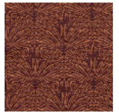
3247-06 DATTIER - BRUGNON