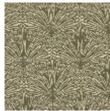
3247-05 DATTIER - KAKI