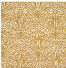
3247-02 DATTIER - MORDORE