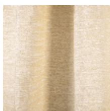
3262-01 DESERT - ECRU