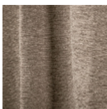
3262-02 DESERT - FICELLE