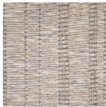
3263-03 SILLONS - GRIS