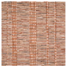
3263-01 SILLONS - TERRACOTTA