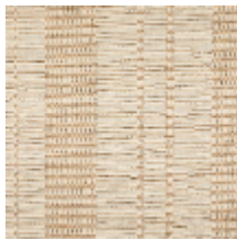
3263-02 SILLONS - ECRU