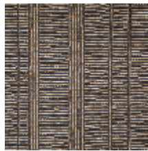
3263-04 SILLONS - MARINE