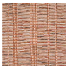
3263-01 SILLONS - TERRACOTTA