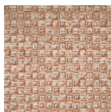
3264-01 NOMADE - TERACOTTA