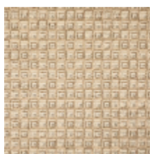
3264-02 NOMADE - BEIGE