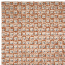
3264-01 NOMADE - TERACOTTA