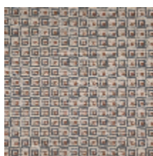
3264-03 NOMADE - GRIS BLEU