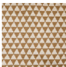
3265-03 KHAIMA - CAMEL