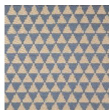
3265-05 KHAIMA - GRIS BLEU