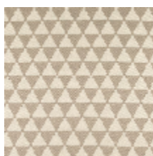
3265-02 KHAIMA - FICELLE