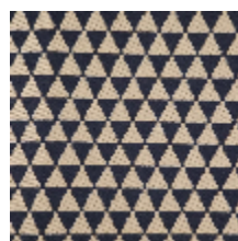
3265-06 KHAIMA - MARINE