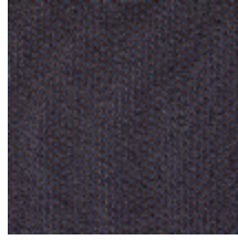
3266-04 LES ENCRES - CARRE