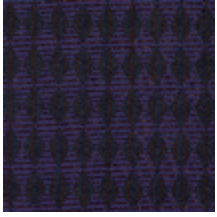
3266-01 LES ENCRES - BIG LOSANGE