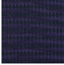
3266-02 LES ENCRES - LOSANGE