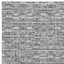
3267-15 LES FUSAINS - ESQUISSE BLANC