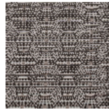
3267-11 LES FUSAINS-BIG ESQUISSE NO