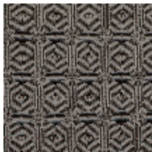
3267-13 LES FUSAINS - DEDALE