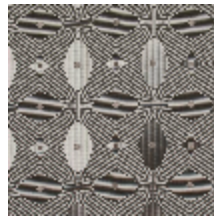
3267-10 LES FUSAINS - BIG DEDALE