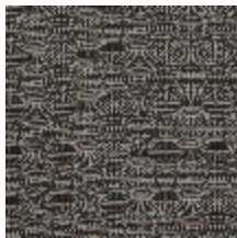
3267-14 LES FUSAINS - ESQUISSE NOIR