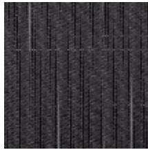
3267-03 LES FUSAINS - LIGNE