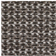
3267-08 LES FUSAINS - DELTA