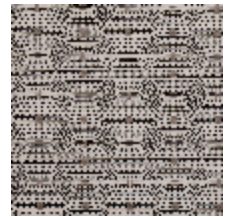
3267-12 LES FUSAINS-BIG ESQUISSE BL