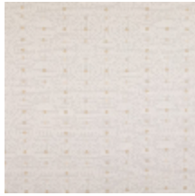
3268-08 LES CRAIES - BIG ESQUISSE