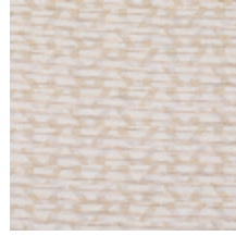
3268-05 LES CRAIES - DELTA