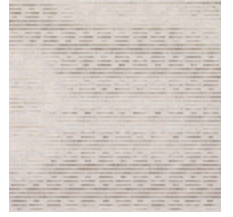
3268-06 LES CRAIES - RECTANGLE