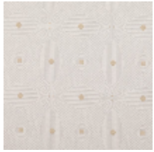
3268-07 LES CRAIES - BIG DEDALE