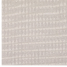
3268-02 LES CRAIES - LOSANGE