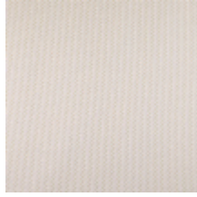
3268-03 LES CRAIES - CARRE