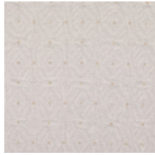
3268-09 LES CRAIES - DEDALE