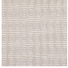
3268-01 LES CRAIES - BIG LOSANGE