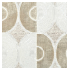
3280-01 EQUINOX - NATUREL