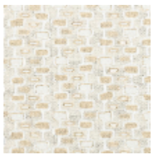
3281-01 ODORICO - NATUREL