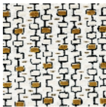
3281-02 ODORICO - MOUTARDE