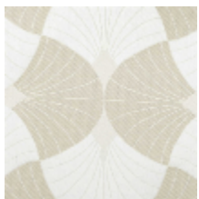
3282-01 FLABELLA - NATUREL