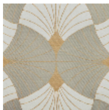
3282-03 FLABELLA - VERT DE GRIS