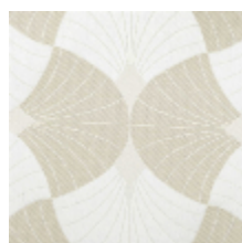
3282-01 FLABELLA - NATUREL