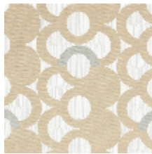
3283-03 MAELSTROM - DUNE