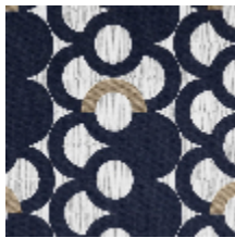
3283-02 MAELSTROM - MARINE