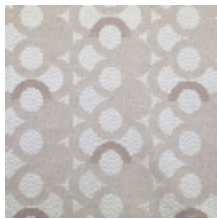
3283-01 MAELSTROM - NACRE