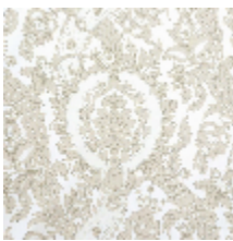
3284-02 LES INDES - NATUREL