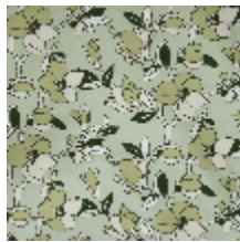
3285-03 SAYURI - SAUGÉ