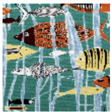
3286-01 LAGON - AZUR