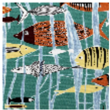
3286-01 LAGON - AZUR