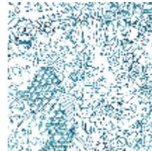
3303-05 HORIMONO - CANARD