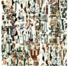
3323-01 AFFICHES - NATUREL