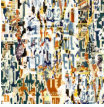
3323-02 AFFICHES - MULTICO