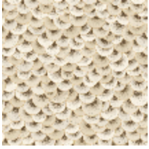
3327-01 ECAILLES OR *