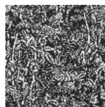
3410-05 AFRIKA - NOIR