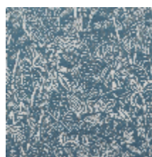
3410-04 AFRIKA - AZUR