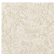
3410-01 AFRIKA - NATUREL