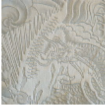
3433-02 KOMODO - BEIGE