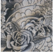
3433-01 KOMODO - GRAPHITE