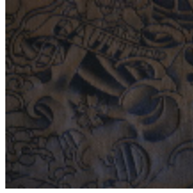
3433-03 KOMODO - NUIT *