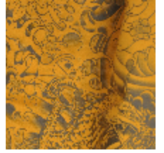
3433-06 KOMODO - GOLD