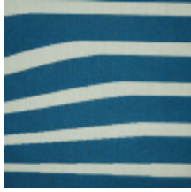
3434-03 ILLUSION - BALTIQUE *