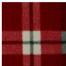
3435-01 KILT - NECTAR