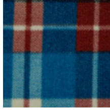
3435-03 KILT - BENGAL