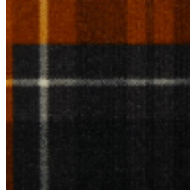
3435-04 KILT - GOLD