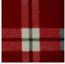
3435-01 KILT - NECTAR