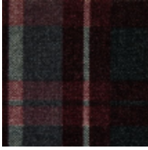
3435-02 KILT - BORDEAUX *