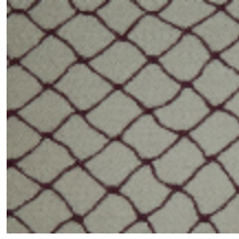
3436-03 CABARET - BORDEAUX *