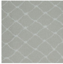
3436-09 CABARET - BEIGE *