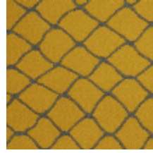
3436-06 CABARET - POLLEN *