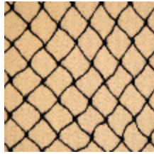
3436-10 CABARET - CHAIR *