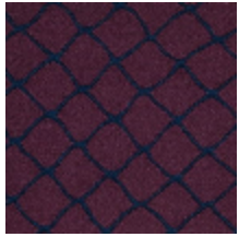
3436-08 CABARET - NECTAR *