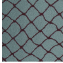
3436-04 CABARET - PORCELAINE *