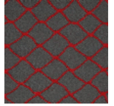
3436-07 CABARET - LAQUE *