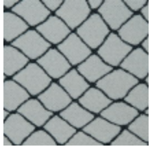
3436-01 CABARET - GRAPHITE *