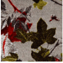
3437-01 MOUSSON - NECTAR