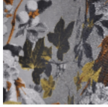
3437-03 MOUSSON - GOLD