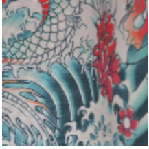
3438-01 ROCK - BENGALÉ