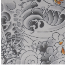
3438-02 ROCK - GOLD