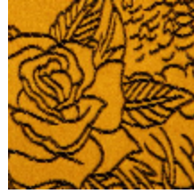
3440-06 SKIN - GOLD