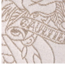
3440-01 SKIN - BEIGE