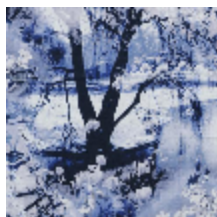
3441-03 VAGABOND - ENCRE *