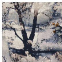
3441-01 VAGABOND - TERRE *