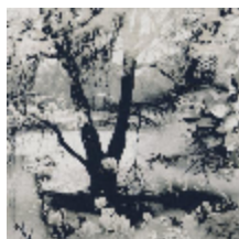
3441-02 VAGABOND - GRAPHITE *