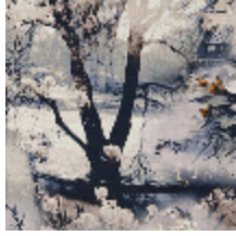
3441-01 VAGABOND - TERRE *