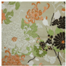
3466-01 KYOTO - TAUPE