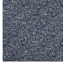
3467-08 OBI - MARINE *