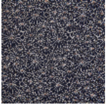
3467-01 OBI - NOIR *