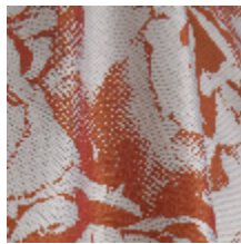
3470-03 PIVONKA - ORANGE