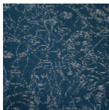
3471-05 REGARD - BLEU *