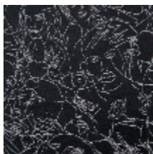
3471-01 REGARD - NOIR *