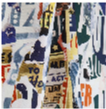
3472-02 METROPOLITAIN - MULTICO