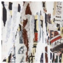
3472-01 METROPOLITAIN - NATUREL